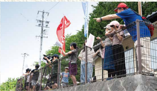
※飯田コアカレッジの学生にボランティアスタッフとして協力いただいています。

大会映像はYouTube ツアー・オブ・ジャパン公式チャンネル 「BPAJ ch」でライブストリーミング配信